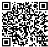
学校採寸専用受注システム